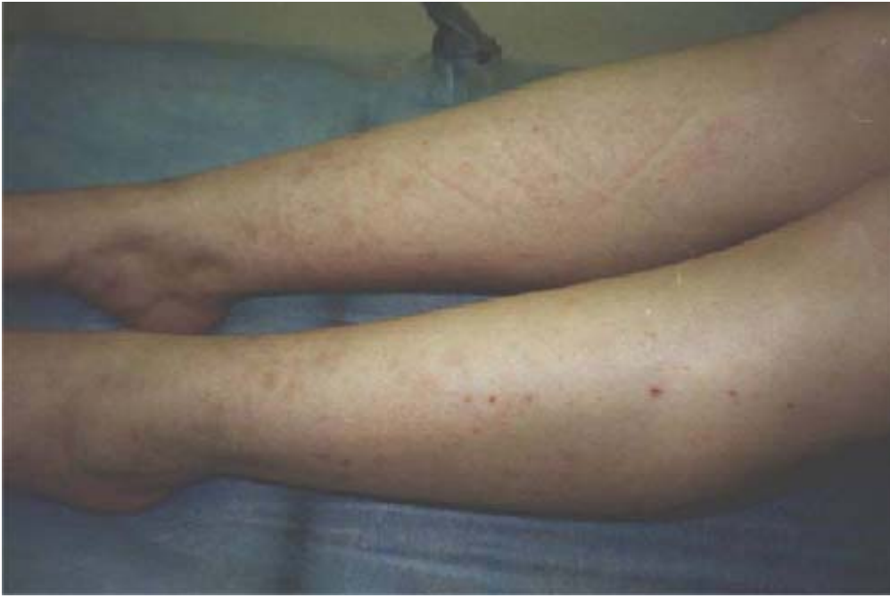
Przewlekłe pigment plamica (po ozonoterapii)