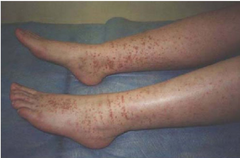
Przewlekłe pigment plamica (przed zabiegami)